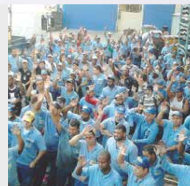
Sindicato presente nas empresas

Cada trabalhador pode e deve ajudar, não apenas comparecendo na assembleia, mas também ajudando na mobilização dos trabalhadores da sua empresa. Somente com a participação de todos, vamos fazer com que este Sindicato continue no caminho certo da luta e complete outros 100 anos.